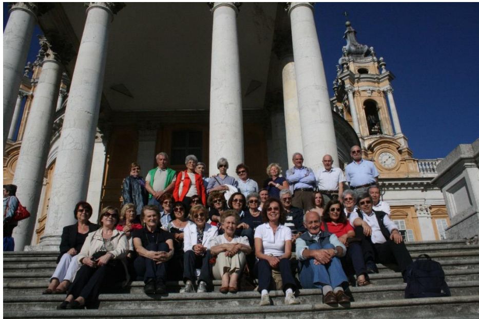
Torino Museo del Cinema e Superga