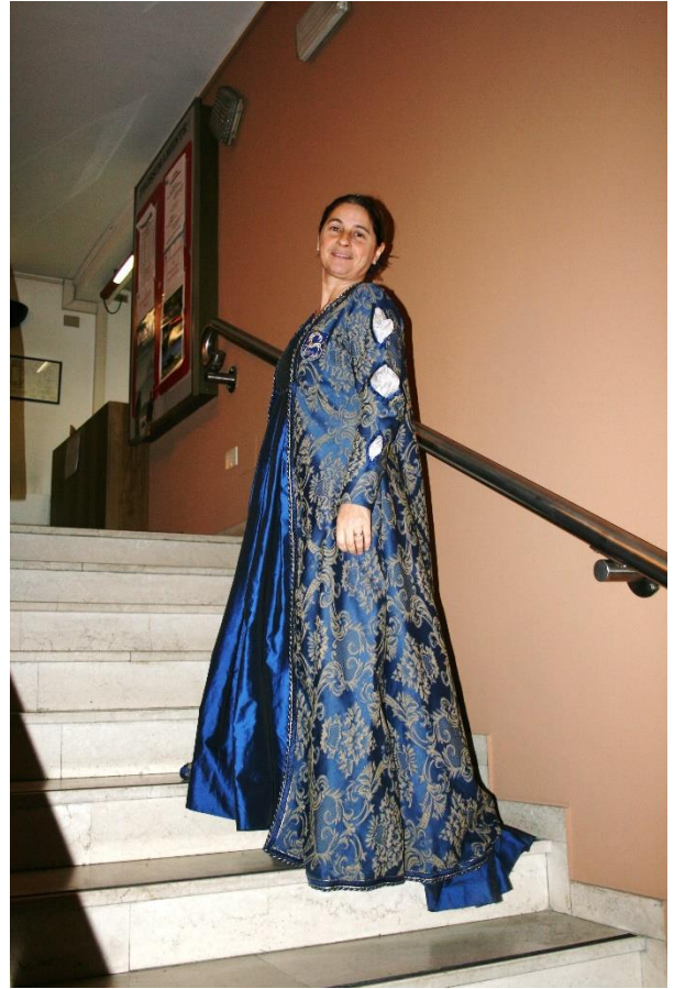
Danze antiche ADA