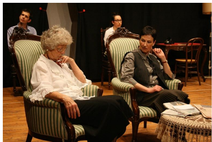
Tre topolini ciechi